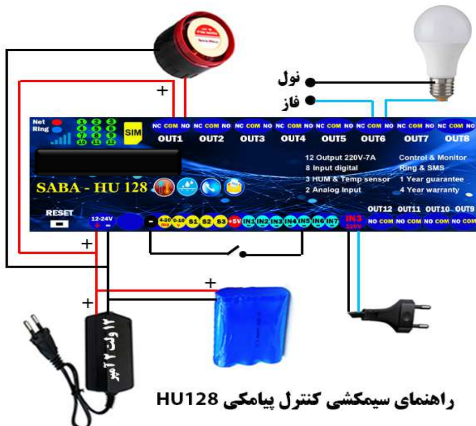
راهنمای سیمکشی کنترل پیامکی HU128

با ارسال دستور *INF6# گزارش مربوط به وضعیت سنسور های دستگاه برای فرستنده پیام ارسال می شود .